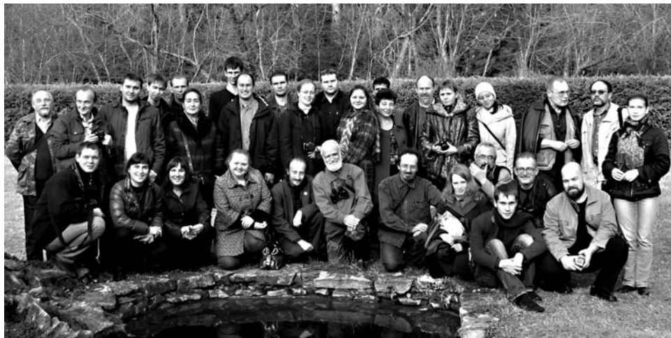
Фото 4. Участники IV съезда Герпетологического общества (Казань, октябрь 2009 г.)

Основные источники финансирования — гранты российских фон-