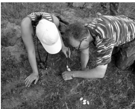
Фото 2. Полевые исследования в Хоперском заповеднике (июнь 2009 г.)

видообразования у чесночниц, морфологии и экологии болотной черепахи, разноцветной ящурки и водяного ужа на севере ареала (фото 2).