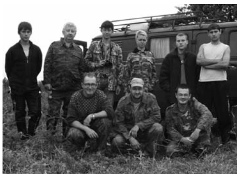
Фото 3. Участники совместной икhtiологической экспедиции ТГУ имени Г.Р. Державина и Мордовского ГУ (август 2009 г.)

2. Составление кадастра животного мира Тамбовской области. Издание «Красной книги Тамбовской области: животные» (2000) и книги «Позвоночные Тамбовской области: кадастр» (2007) стало событием в жизни региона. Сейчас готовится второе издание Красной книги. Благодаря интенсивной экспедиционной работе, проводимой ЦЭФИ совместно со специалистами из других организаций, существенно расширились наши представления о пауках, насекомых, рукокрылых, рыбах и других животных (фото 3).