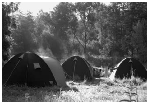
Фото 1. Лагерь полевой практики по зоологии на берегу р. Керша (июнь 2009 г.)

Выросло число учащихся профильных классов, студентов и аспирантов, участвующих в выездных полевых практиках по зоологии. Это стало возможным благодаря современному оборудованию, необходимому для проведения полевых зоологических исследований (фото 1).