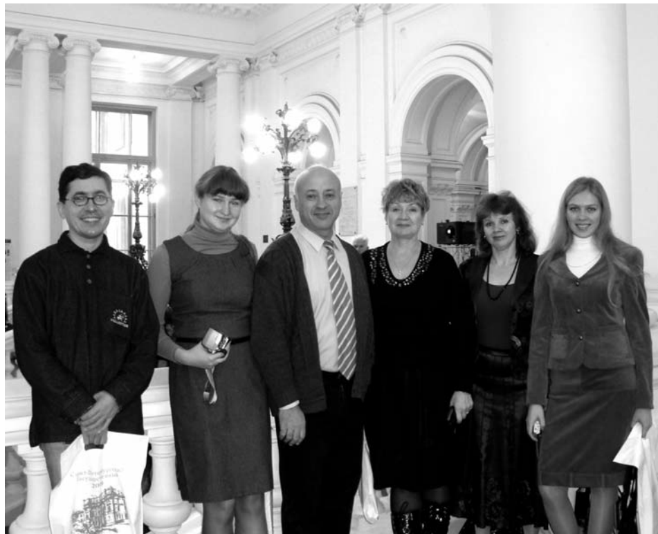
Делегация лаборатории на форуме «Инновации: наука, образование, бизнес» в Санкт-Петербурге

Только в декабре 2009 г. результаты исследовательской деятельности сотрудников — ведущих ученых научно-педагогической школы «Преподавание иностранных язы-