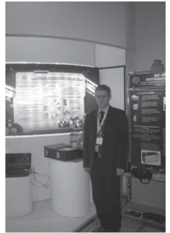
Стенд, посвященный инновационной деятельности УИЦ «НТИНМ»

Экспозиция УИЦ «НТИНМ» была посвящена достижениям и результатам деятельности Центра в