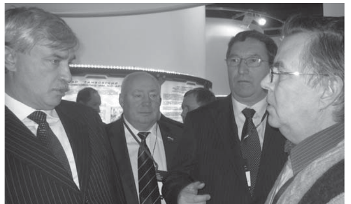
Обмен мнениями о достижениях и перспективах развития нанотехнологий в Тамбовской области