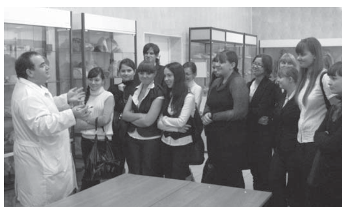
Лицейсты в Анатомическом музее Медицинского института