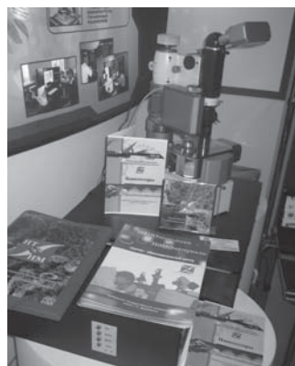
Универсальный динамический нотестер, разработанный в УИЦ «НТИНМ»

Опытный образец многофункционального универсального динамического микро-нотестера, вызвал живой интерес у участников и гостей выставки. За три дня работы выставки стенд Центра посетили