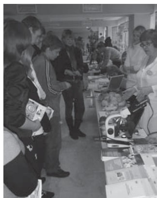
Учащиеся МОУ Калаиской СОШ Кирсановского района осматривают выставочную экспозицию Медицинского института

Активное участие в проведении выставки приняли все подразделения ТГУ имени Г.Р. Державина. Особо следует выделить Институт математики, физики и информатики, Медицинский институт, Институт сервиса и рекламы, Институт физической культуры и спорта, Академию экономики и управления, Академию культуры и искусств, Издательский дом ТГУ имени Г.Р. Державина, Зооботанический сад.