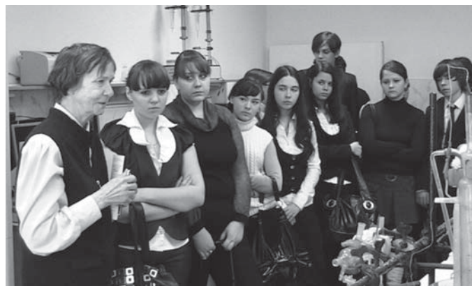
Старшеклассники МОУ лицея № 28 имени Н.А. Рябова в лаборатории электрохимии и коррозии металлов Института естествознания