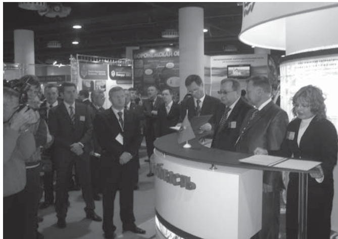
Презентация выставочного стенда Тамбовской области

В своем приветственном слове к участникам и гостям выставки Полномочный представитель Президента Российской Федерации в Центральном федеральном округе Г.С. Полтавченко отметил, что в текущем году экономика ЦФО восстанавливалась после кризиса: по итогам 9 месяцев текущего года «окружной» индекс промышленного производства составил 107,4%; увеличиваются бюджетные доходы (за 9 месяцев в консолидированный бюджет Российской Федерации из Центрального федерального округа поступило около 1,9 трлн рублей налоговых и неналоговых доходов или 117,9% от объема поступлений аналогичного периода в прошлом году). Что касается инновационного развития в округе, то дела здесь пока оставляют желать лучшего. Хотя, как заметил Г.С. Полтавченко, в инновационной сфере уже есть и яркие примеры – в ряде областей ЦФО введены в строй ряд современных производств с применением нанотехнологий. В своем выступлении полпред отметил также необходимость стратегического планирования в