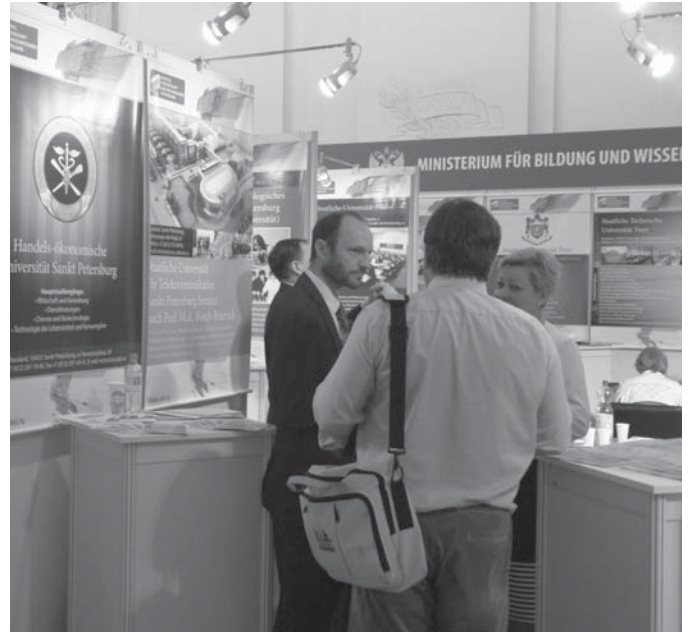
Посетители выставки интересуются российской системой образования.

Российская часть выставки была наиболее обширной и оформленной в едином стиле. От России в выставке участвовало 34 учебных заведения, среди которых МГУ имени М.В. Ломоносова, Московский государственный университет приборостроения и информатики, Томский национальный исследовательский