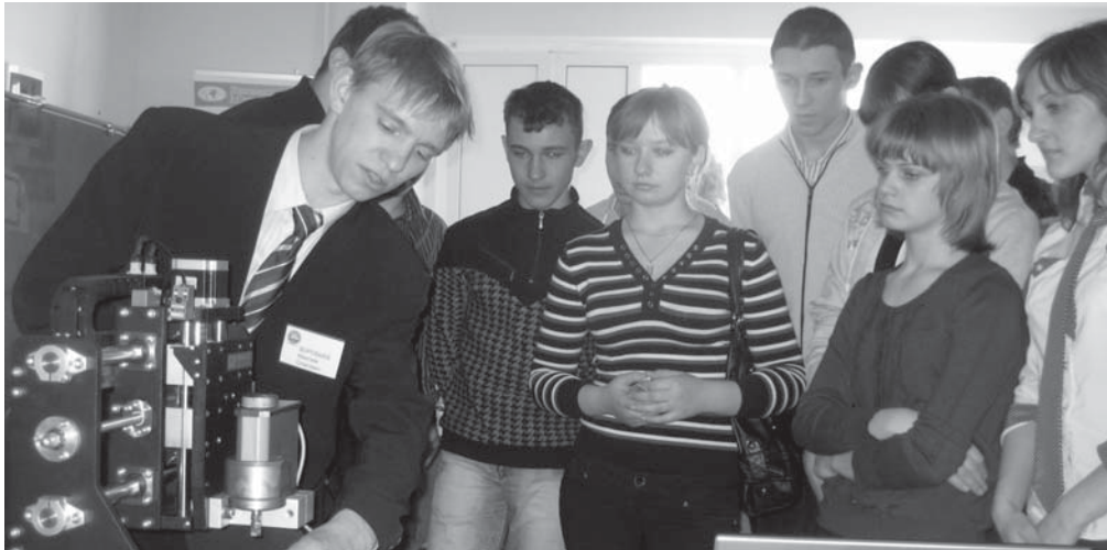
Старшеклассники Токаревского района осматривают выставочную экспозицию Учебно-инновационного центра «Нанотехнологии и наноматериалы»

Ц ель выставки – доведение до широкого круга ответственности результатов инновационной деятельности центров и лабораторий ТГУ, а также популяризация среди учащихся старших классов школ г. Тамбова и Тамбовской области проектной инновационной деятельности.