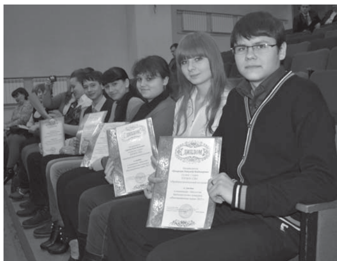
Победители и участники конкурса «Инновационные идеи»