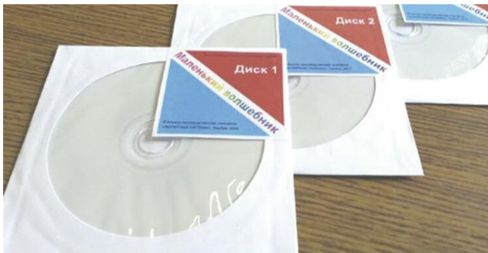
На фотографии: программный комплекс «Маленький волшебник», включает три отдельных установочных диска, лечение с использованием каждого этапа назначает врач

Данный эффект достигается с помощью специализированных технических средств, как аппаратных, так и программных: испытываемому предлагается манипулировать, совмещать, следовать или каким-либо другим образом взаимодействовать с объектами на