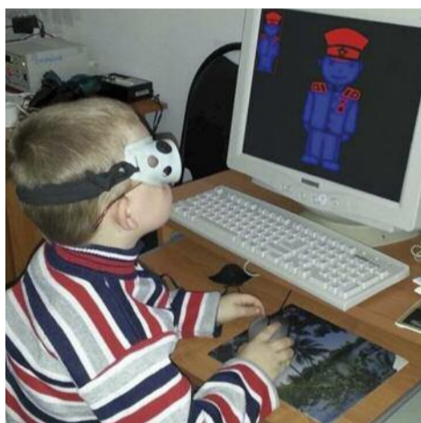
На фотографии: пациент проходит лечение с использованием комплекса «Маленький волшебник»

экране, представленными в красном и синем цветах. В результате таких тренировок мозг ребенка обучается совмещению данных объектов.