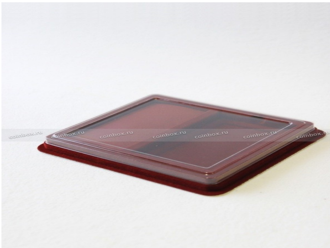
Рисунок № 3

Нагрудный знак «Персона года» упаковывается в блистер (рис. №3) (150x180мм) с подложкой красного цвета под золотой знак (рис. № 4) и подложкой синего цвета под серебряный знак (рис. № 5). Справа расположен ложемент под удостоверение с обложкой соответствующего цвета.