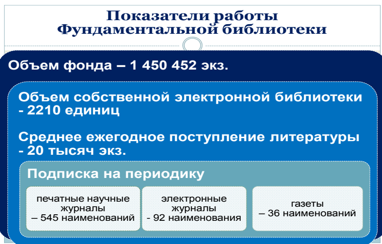
Рис. 1. Показатели работы Фундаментальной библиотеки

Общая площадь помещений библиотеки – 2 992 м 2 , библиотека располагается в 5 корпусах Университета.