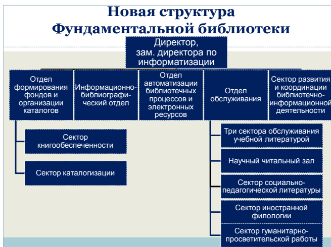
Рис. 6. Структура Фундаментальной библиотеки