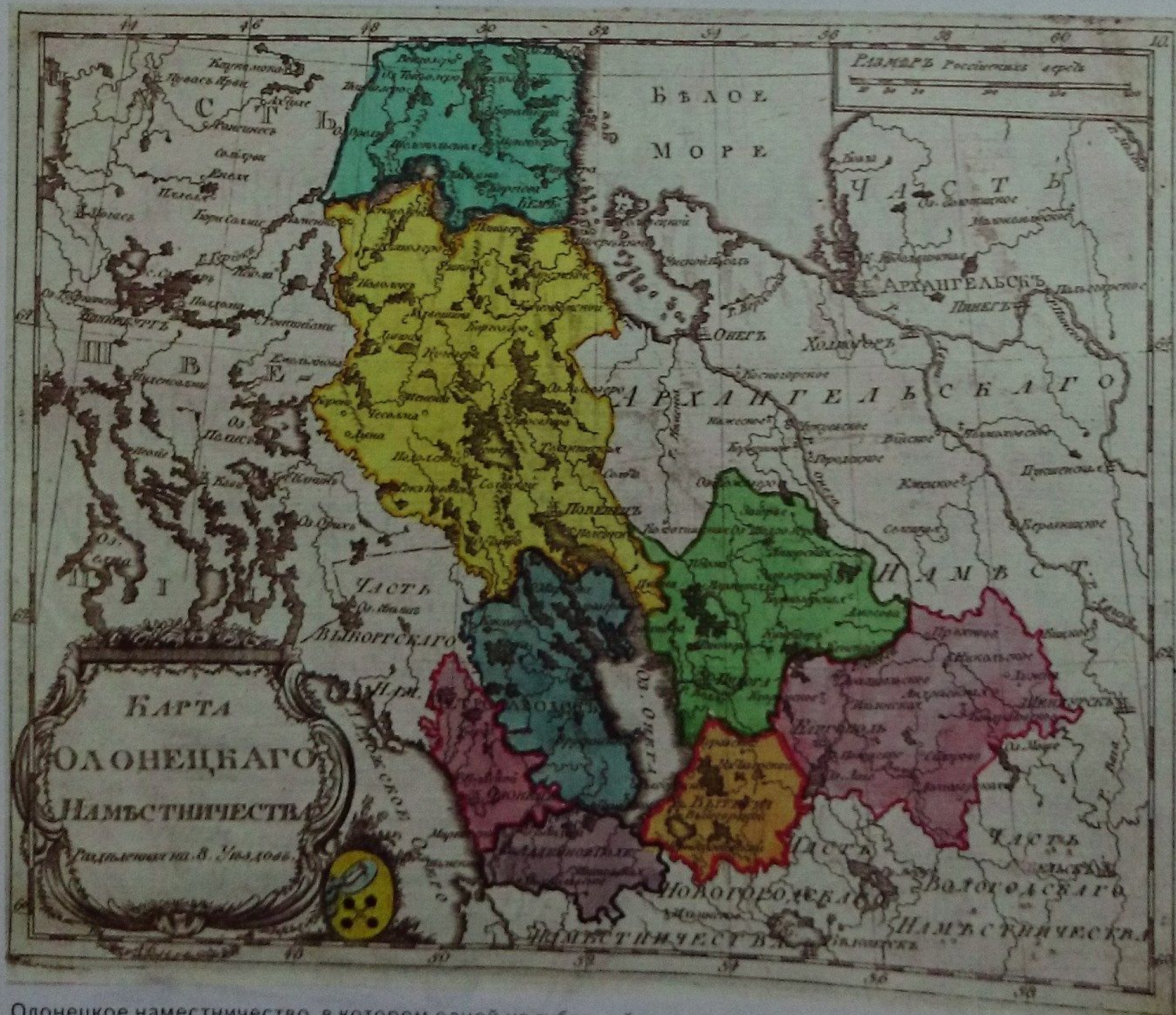
Олонецкое наместничество, в котором одной из губерний руководил Гавриил Державин, в XVIII веке было самым крупным на северо-западе России.

Генерал-губернатору в этой управленческой конструкции отводилась роль стратега-куратора: он не занимался рутинной, а обеспечивал «правильную линию» развития региона. На губернатора же возлагались тактические задачи управления вверенной территорией. И все было бы хорошо, если бы не частые конфликты между генерал-губернаторами и губернаторами на почве споров о разграничении властных полномочий. А происходили они из-за размытой формулировки закона, в тексте которого не было конкретных инструкций, как следовало действовать двум высшим чиновникам на местах в случаях спора и административных коллизий. Это вносило особый колорит в систему местного администрирования, порождало ка-