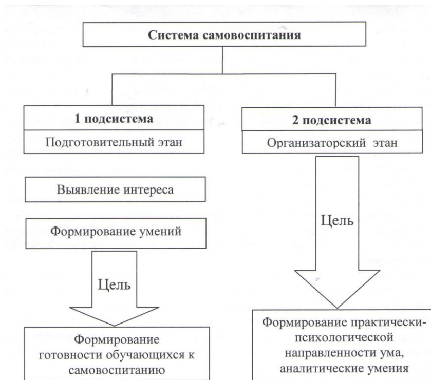
рис. 2. Система самовоспитания

Все подсистемы имеют определённую зависимость друг от друга, но в то же время могут существовать самостоятельно. Каждая подсистема имеет свои дидактические особенности и отличия, связанные с использованием различных методов и средств самовоспитания, со сложностью решаемых задач: имеет цель, которая обеспечивает достижение конечной цели - формирование умений профессионального и межличностного общения обучающихся.