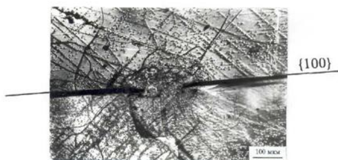
Рис. 2. Участок восстановившейся сплошности в русле трещины, LiF 10^{-3} вес.%

За определенное время термоэлектрического воздействия развивающийся нарост перемыкал берега трещины, приводя к восстановлению сплошности (рис. 2).