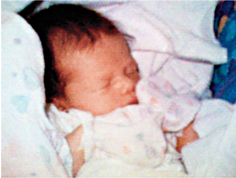
Рис. 3 «Первое фото на сотовом телефоне», Филипп Кан, 1997

Различают художественную и нехудожественную фотографию, которые, в свою очередь, выражаются в различных жанрах. И если, художественная фотография, как художественное направление, глубоко изучается искусствоведами, то более массовой нехудожественной уделяется мало внимания. Хотя именно она и содержит в себе особенности современной культуры.