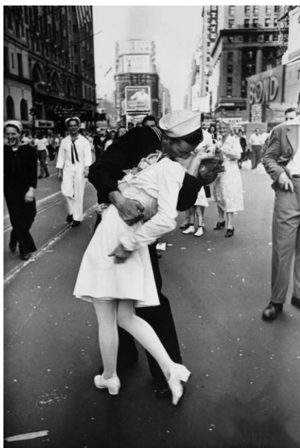
Рис.1 «День победы на Таймс-сквер», Альфред Эйзенштадт, 1945

Далее рассмотрим фотографию как транслятор ценностей. При помощи анализа фотографий человека мы можем выделить его ценностные ориентации, или при помощи демонстрации фотографий можем подтолкнуть человека к формированию необходимых ценностных ориентаций (рис.1).